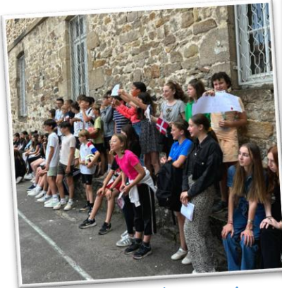
Tournoi de foot

Parce que la vie au collège ne se limite pas aux heures d'enseignement, nos collégiens bénéficient de moments festifs, de partage et de découverte grâce à l'implication de leurs professeurs et encadrants.