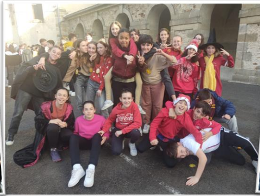
Fête de Noël