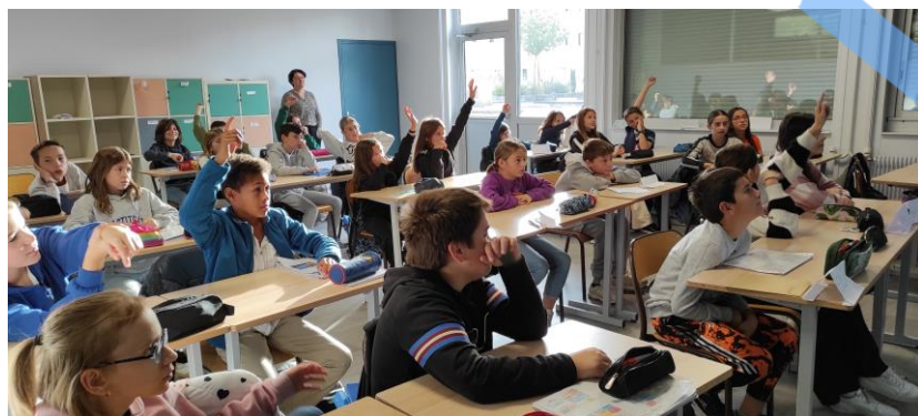
Intervention sur sécurité du transport de jeunes