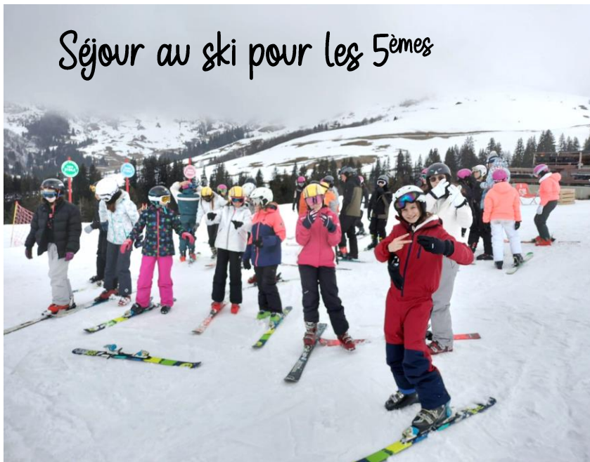
Séjour au ski pour les 5 èmes