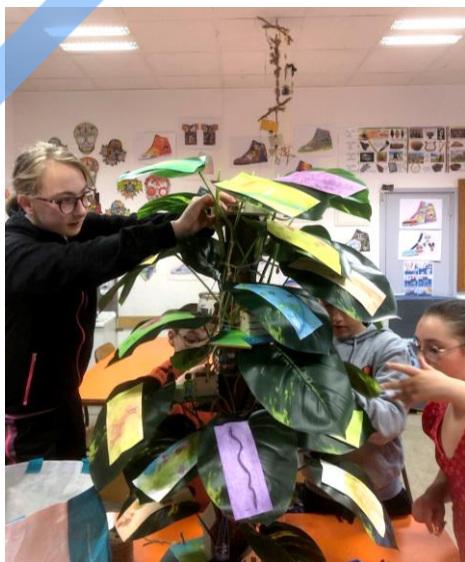
Projet Archi Gravé

Le collège organise de nombreuses rencontres et visites pour permettre aux élèves de s'ouvrir au monde qui les entoure.