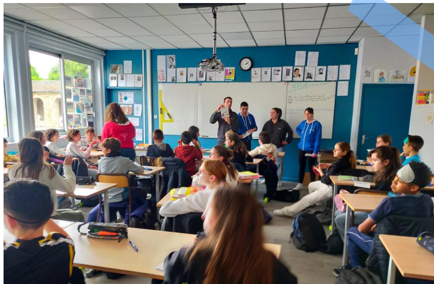
Intervention d'étudiants infirmiers sur la santé