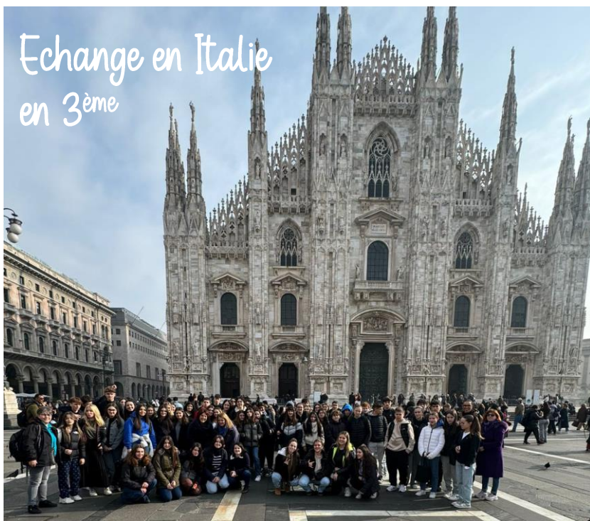
Echange en Italie en 3 ème