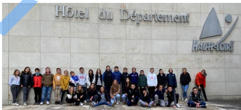
Visite de l'hôtel du Département