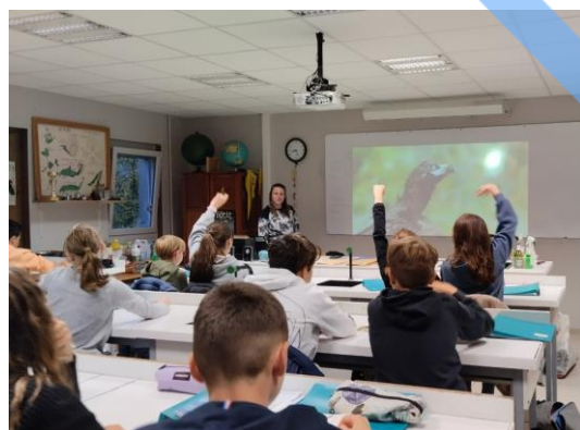
Commémoration 11 novembre