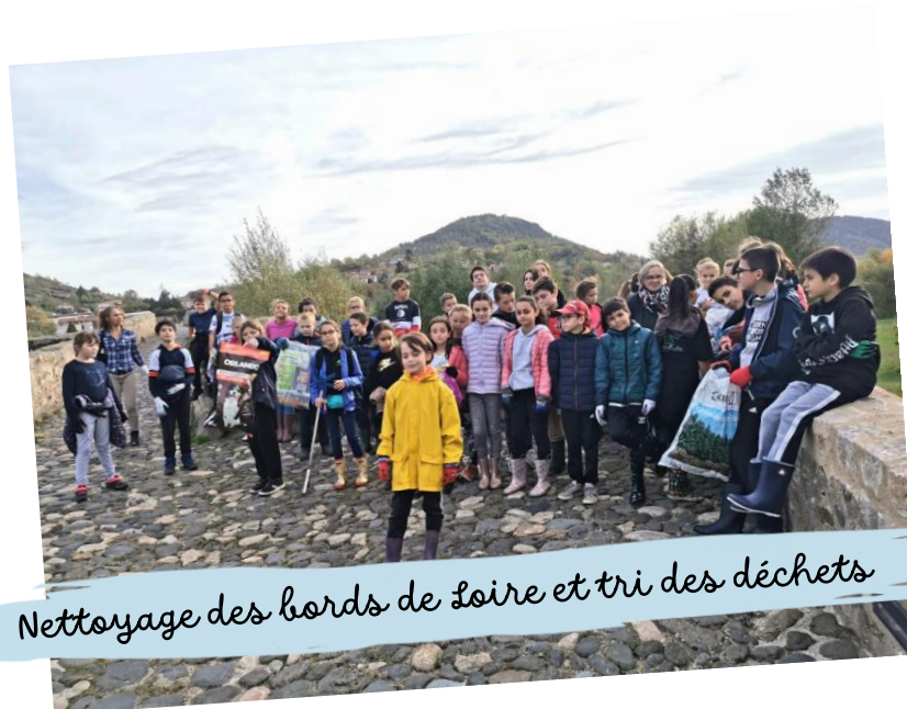
Nettoyage des bords de Loire et tri des déchets

Tout au long de l'année, le collège organise et participe à des actions de solidarité et de citoyenneté pour développer chez les élèves des valeurs altruistes. Ils vont à la rencontre d'associations pour mieux comprendre l'esprit de solidarité qui anime les bénévoles.