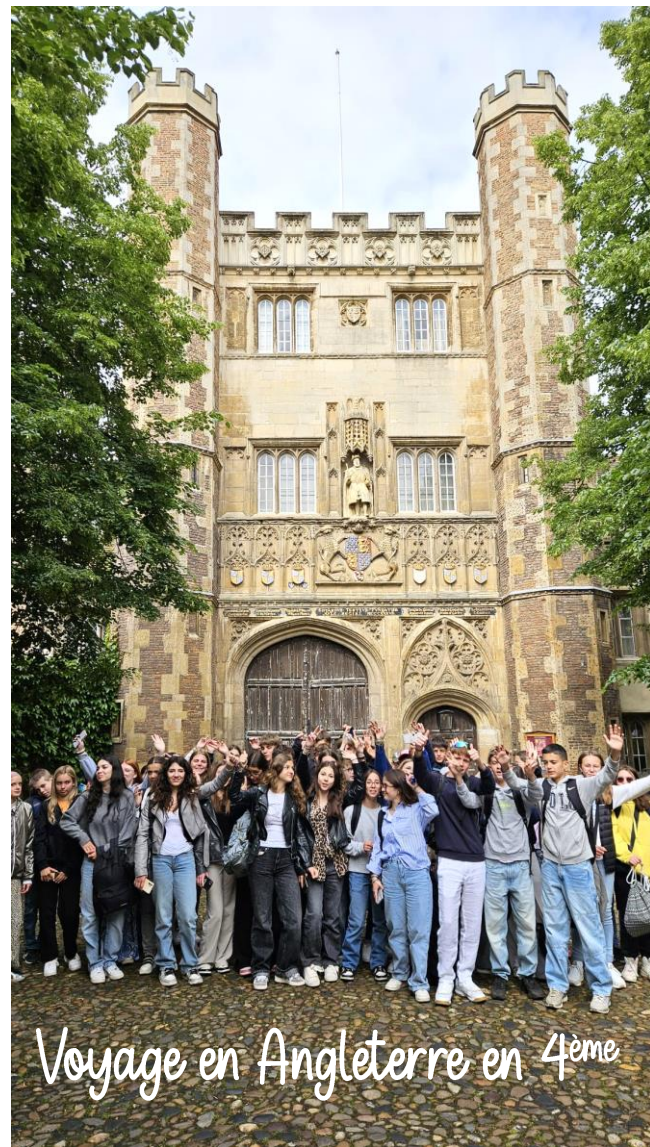
Les voyages scolaires en images...