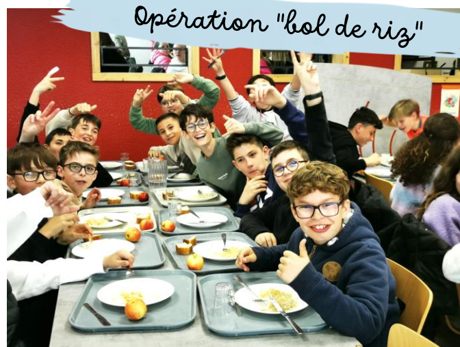
Opération "bol de riz"