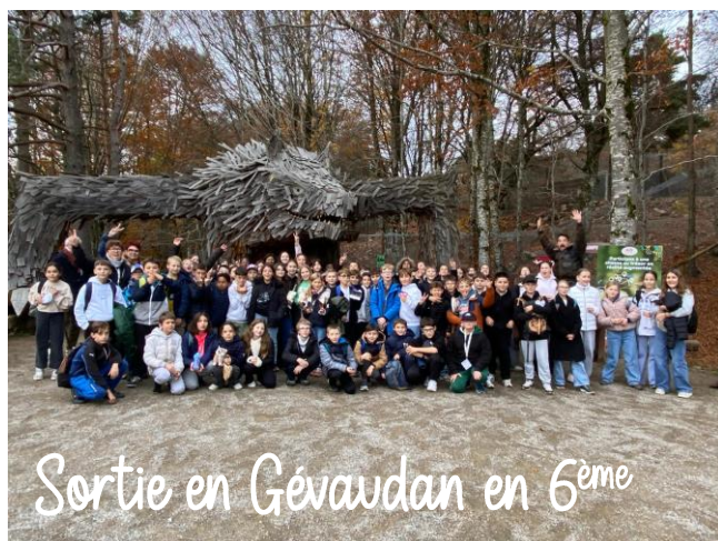
Sortie en Gévaudan en 6 ème