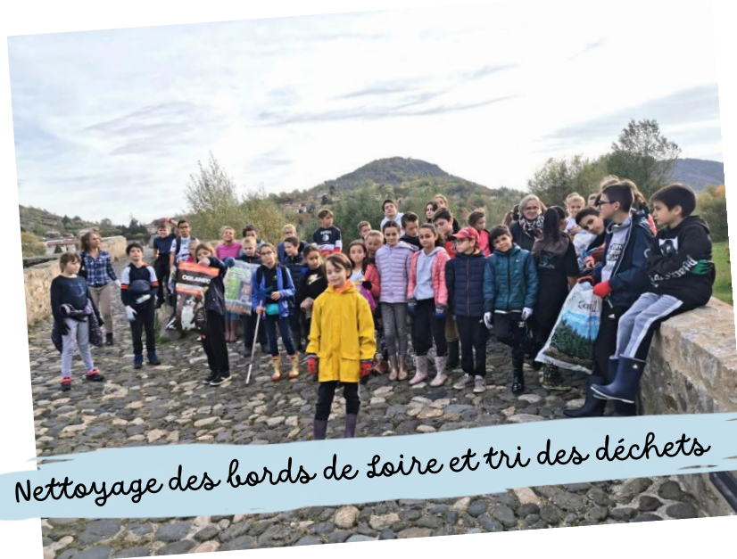
Nettoyage des bords de Loire et tri des déchets

Tout au long de l'année, le collège organise et participe à des actions de solidarité et de citoyenneté pour développer chez les élèves des valeurs altruistes. Ils vont à la rencontre d'associations pour mieux comprendre l'esprit de solidarité qui anime les bénévoles.