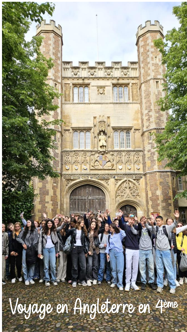
Voyage en Angleterre en 4 ème